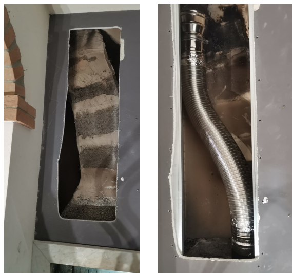
Particolare dell'apertura della controcappa e della sostituzione del vecchio tubo in cemento con uno nuovo in acciaio