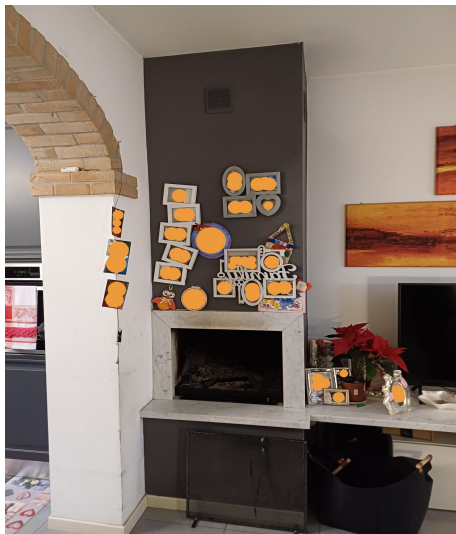
Caminetto esistente con struttura in muratura e cartongesso